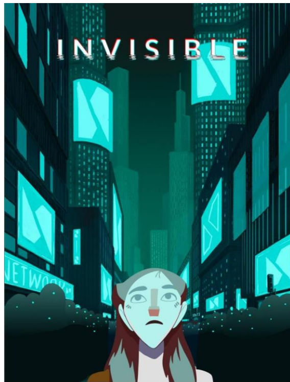
Imagen 1. Cartel de Invisible, de Paola Tejera.

que impacte. Es importante dominar las reglas de composición. Aunque no se trate precisamente de un tutorial para realizar carteles, puede ser conveniente que veas este vídeo de Ter donde habla de los principios compositivos de los “thumbnails” que diseña El Rubius, ya que destaca principios compositivos clásicos que resultan claros y llamativos visualmente: https://www.youtube.com/watch?v=2SLWktEO-UI